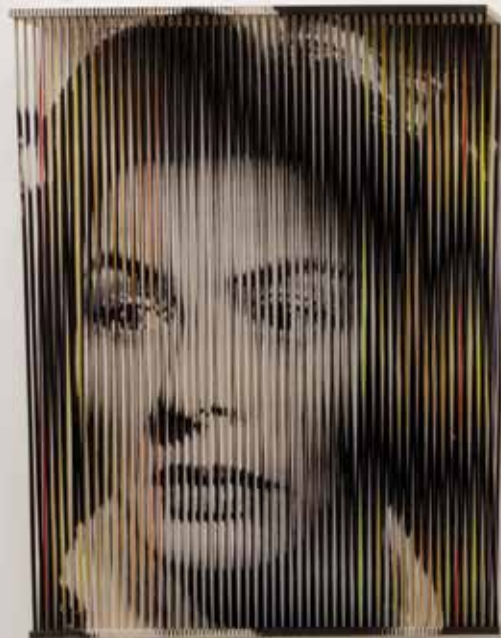
Ingrid Bergman , 2018 143 x 108 x 25 cm (Filmstill: La Paura) Fotoemulsion, Acrylfarbe/Holz