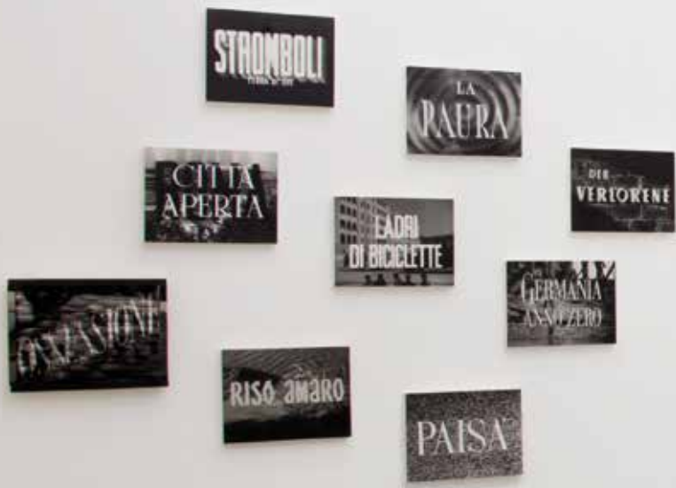
Film-boards, 2018, Fotoemulsion auf Holz, 40 x 30 cm