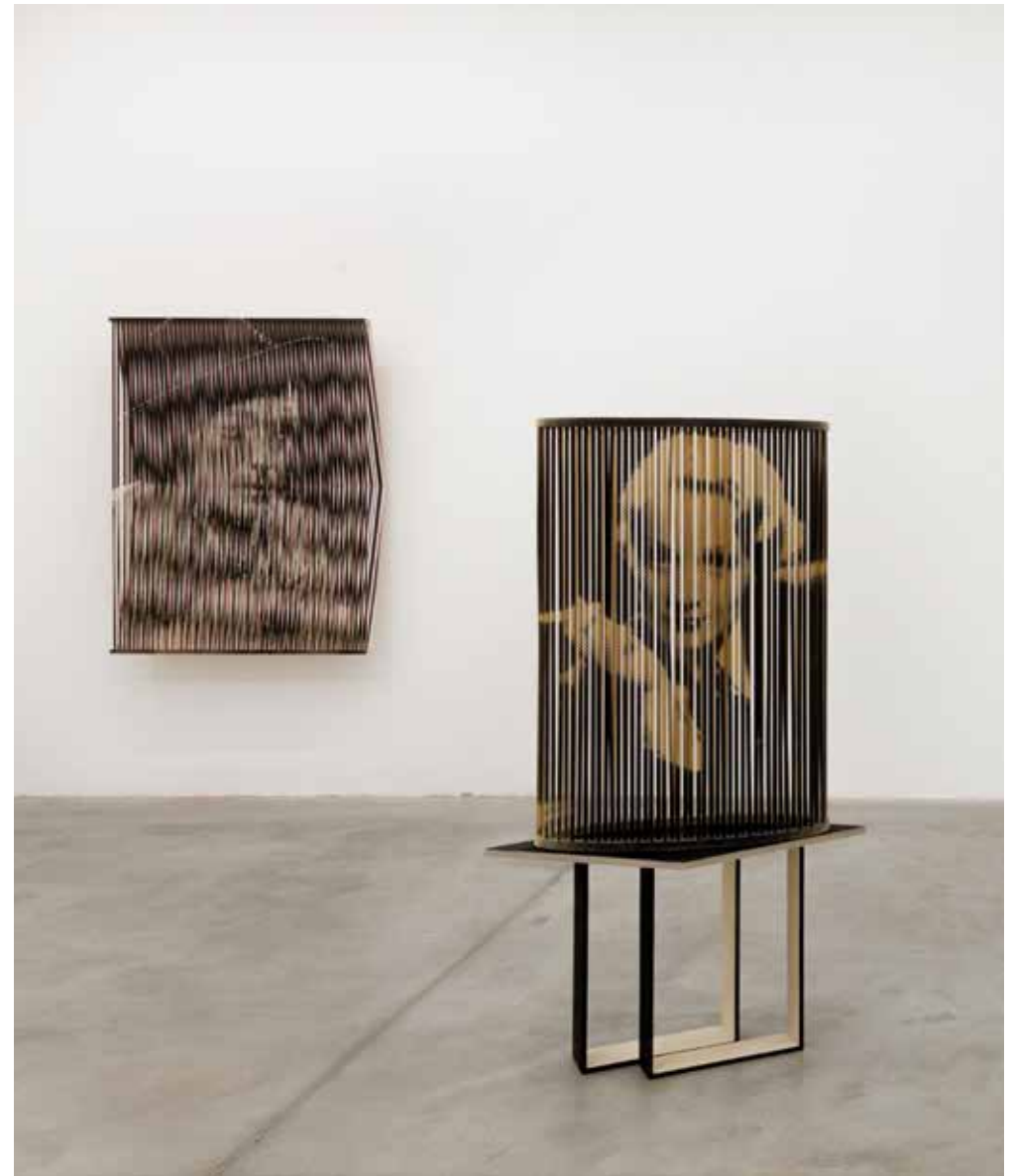
Marlene und Hildegard , 2013/2015 100 x 70 x 33 cm Fotoemulsion auf Holz