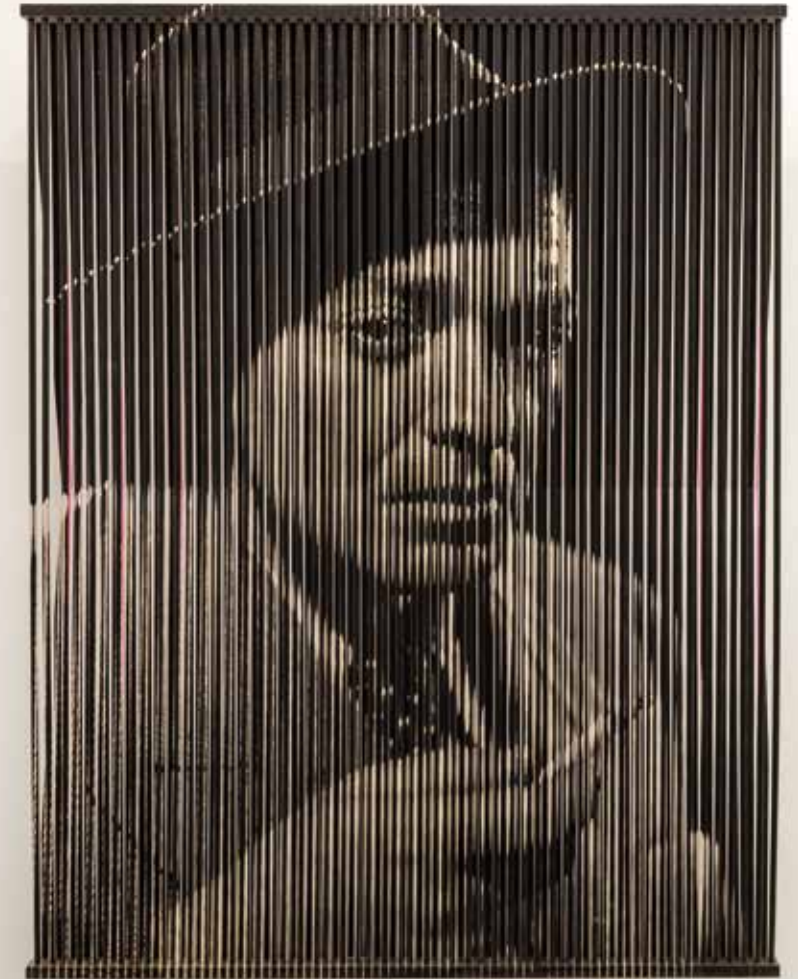
Peter Lorre , 2018 143 x 108 x 25 cm (Filmstill: Der Verlorene) Fotoemulsion, Acrylfarbe/Holz