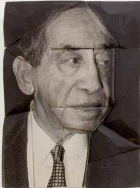
Siegfried Kracauer, 2018 70 x 50 x 10 cm Fotoemulsion/Holz