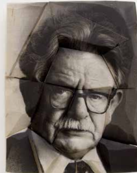
Elias Canetti, 2018 70 x 50 x 10 cm Fotoemulsion/Holz Foto: 1975, Horst Tappe/Ullstein Bild, picturedesk.com