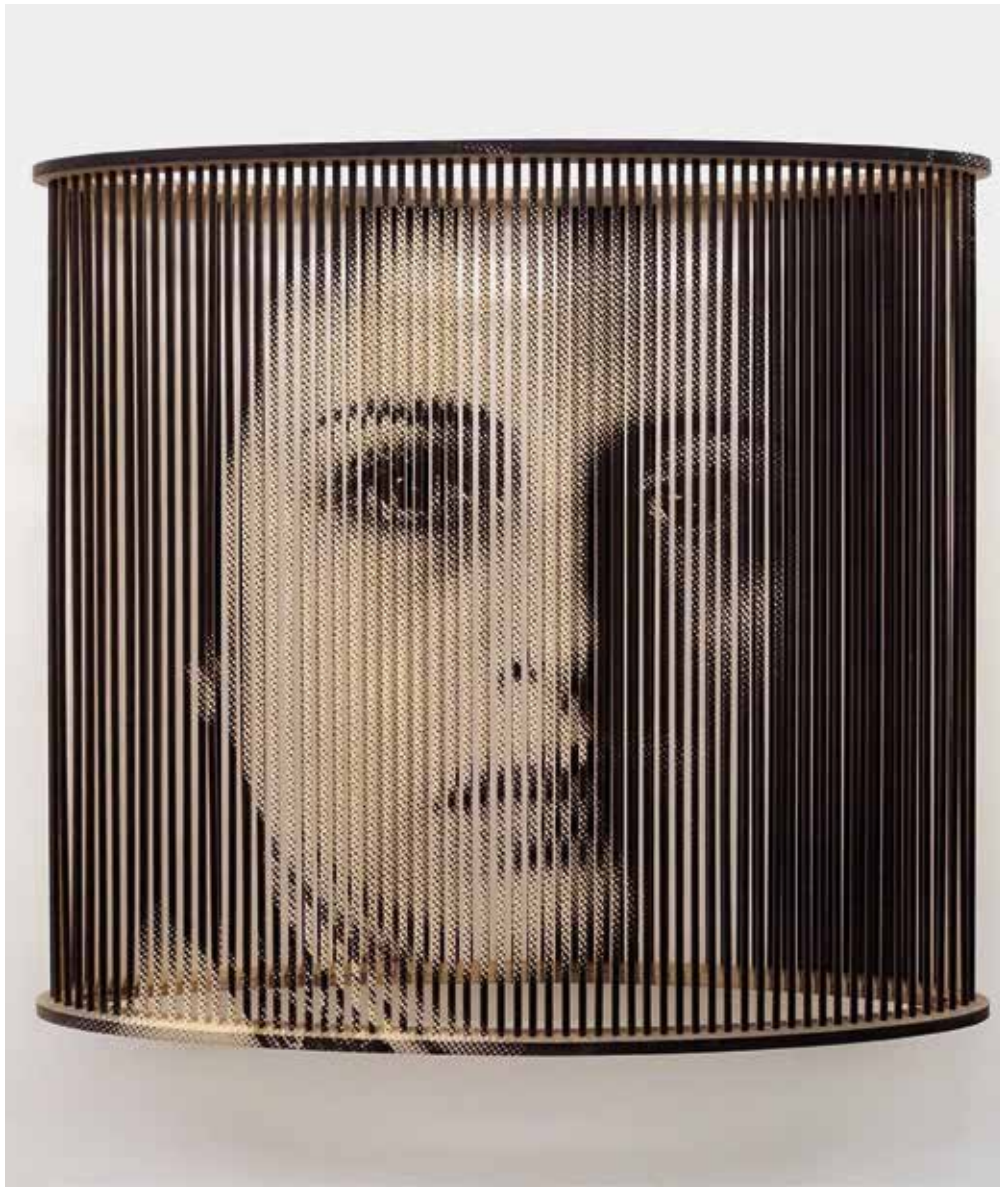
Simone Signoret , 2018 140 x 90 x 15 cm Foto: c. 1940s, Everett Collection/picturedesk.com Fotoemulsion, Acrylfarbe/Holz