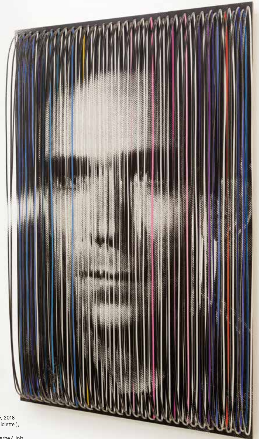
Lamberto Maggiorani, 2018 (Filmstill: Ladri di biciclette ), 140 x 90 x 25 cm Fotoemulsion, Acrylfarbe/Holz