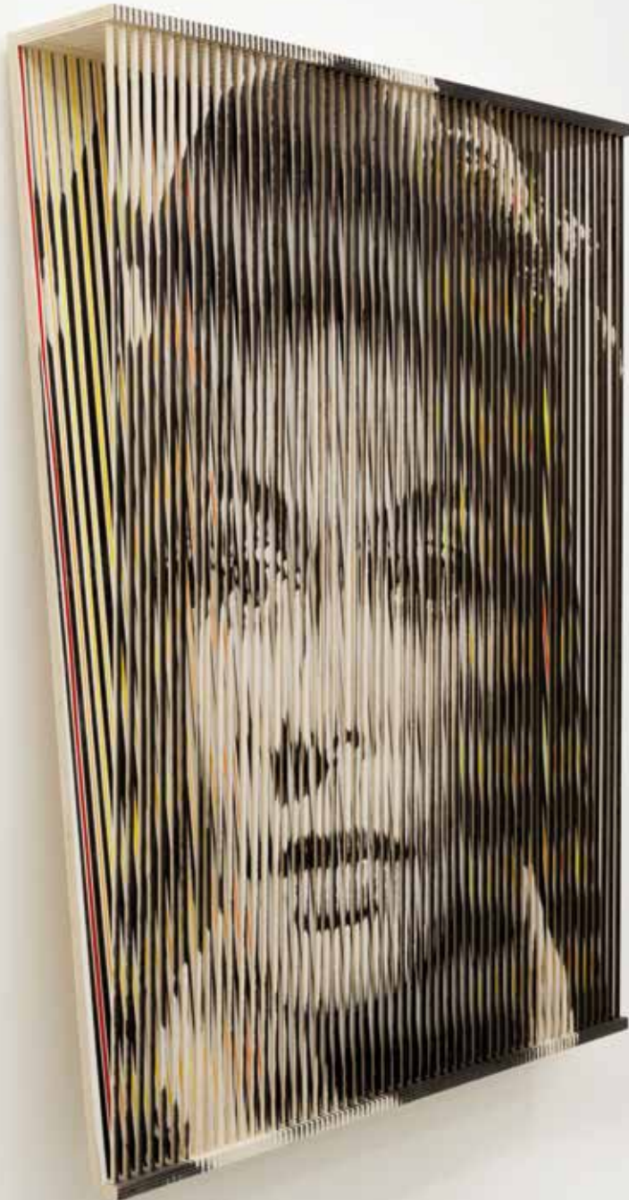
Ingrid Bergman, 2018 143 x 108 x 25 cm (Filmstill: La Paura) Fotoemulsion, Acrylfarbe/Holz Foto: 1954, Lu Wortig/Interfoto/picturedesk.com